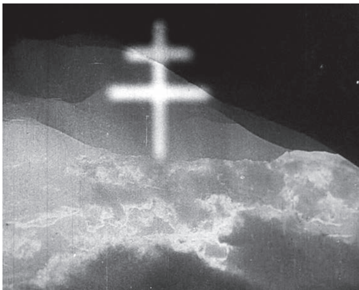
[4] Záverečná scéna filmu Jánošík , 1935