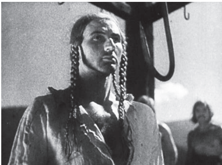
[3] Palo Bielik v záverečnej scéne filmu Jánošík , 1935